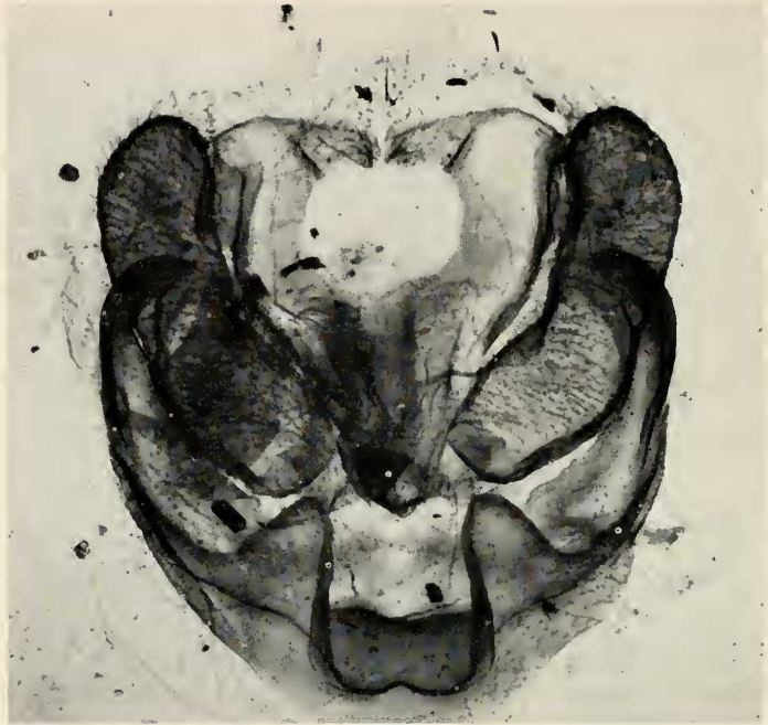
Abb. 3: Hepialus bertrandi Le Cerf (Hautes Alpes, Mte. Viso, 17. VII. 1954) Männlicher Genitalapparat

Nach ungefähr 20 Tagen beginnen die Raupen zu schlüpfen. Sie haben eine Länge von 2 mm, der Körper ist gelblich mit einzelnen Haaren, der Kopf verhältnismäßig groß, leicht glänzend, braun.